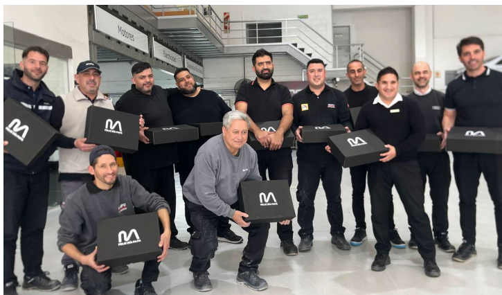
Día del Padre

Hemos organizado eventos especiales como el Día del Niño, la fiesta de fin de año y celebraciones por logros individuales y colectivos, fortaleciendo el sentido de pertenencia a la empresa.