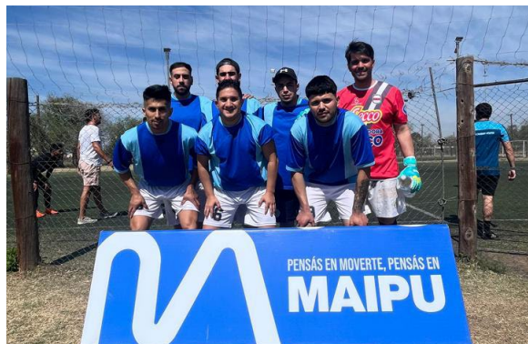
Torneo Maipú Fútbol 7