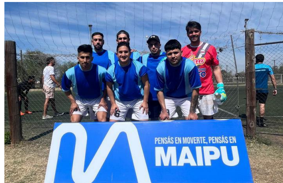
Torneo Maipú Fútbol 7